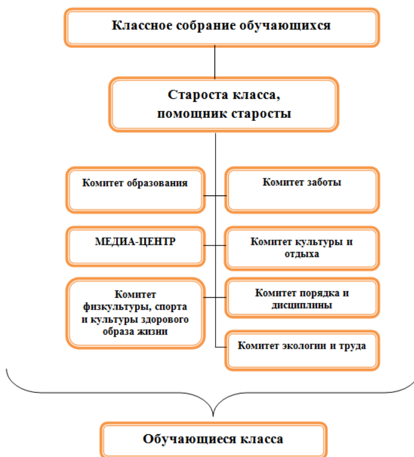
Схема 2. Уровень классного самоуправления

Данный уровень самоуправления дает обучающимся возможность раскрыть свои личностные качества, получить опыт реализации различных социальных ролей в процессе разработки плана классных дел, подготовки и организации разнообразных событий класса.