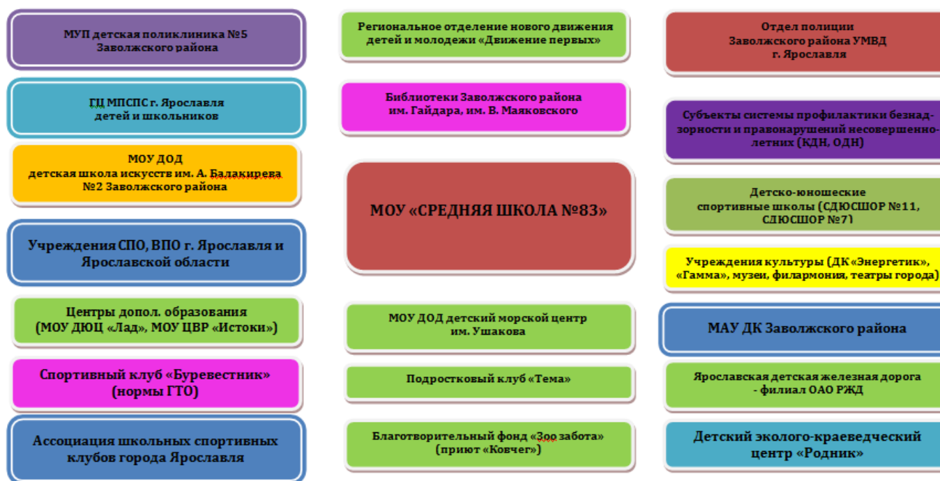
Схема 3. Взаимодействие школы с социальными партнерами.