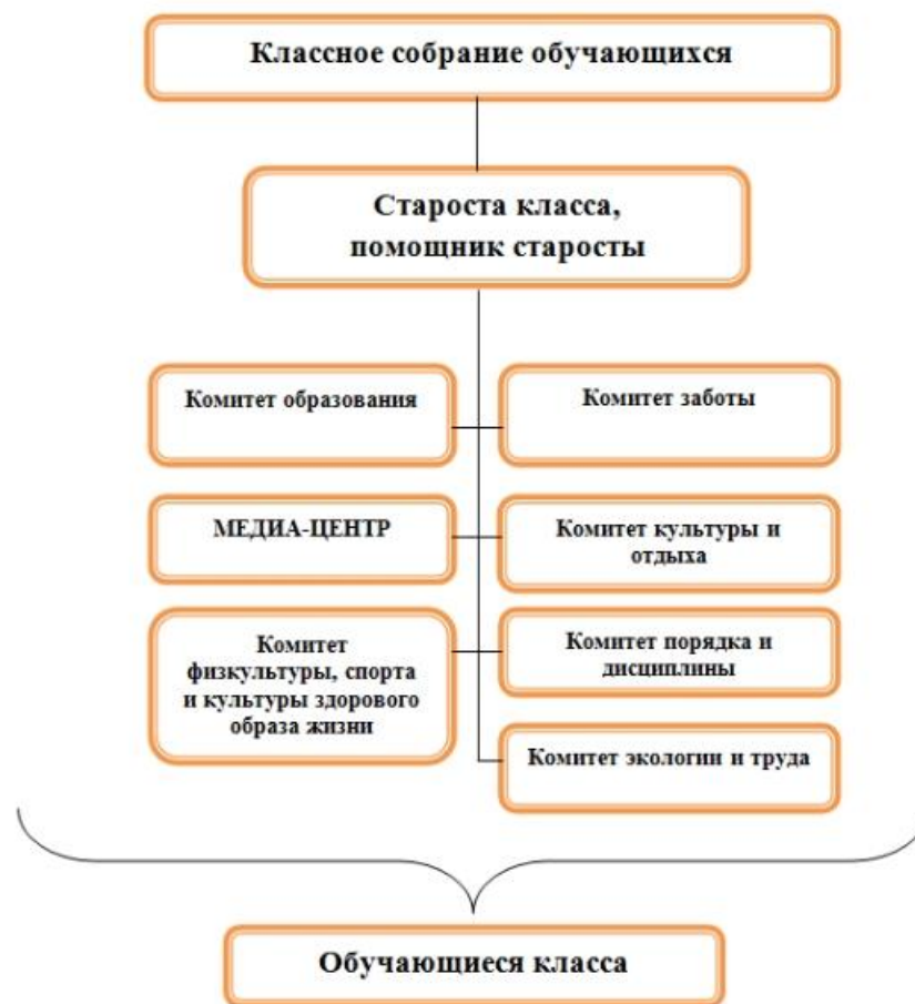
Схема 2. Уровень классного самоуправления